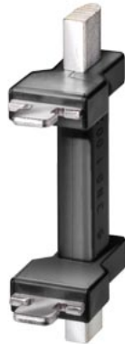
coltelli sezionatori NH gr. 2 attacchi liberi da tensione