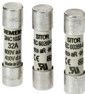
SITOR- cartuccia fusibile cilindrica, 10x38 mm, 32 A, aR, Un AC: 600 V