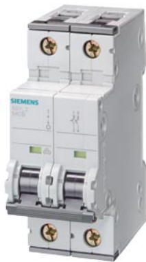
interruttore magnetotermico 230 V 10 kA, 1+a N poli, D, 63A, P=70mm