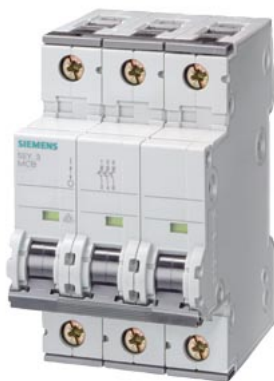
Interruttore magnetotermico 400V 10 kA, a 3 poli, C, 40A, P=70mm