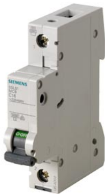
interruttore magnetotermico 230/400 V 6kA, a 1 polo C, 6A esecuzione Italia