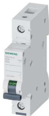
interruttore magnetotermico 230/400 V 10 kA, a 1 polo, D, 32A