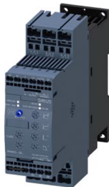
SIRIUS softstarter S0 25 A, 11 kW/400 V, 40 °C AC 200-480 V, AC/DC 24 V morsetti a molla