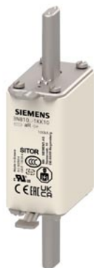
cartuccia fusibile SITOR grandezza costruttiva 0 50A aR DC 600V/900V VSI DC 750V UL @MBC 4xIn contatti a coltello