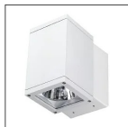
QUADRO MONO MCL