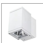
QUADRO MONO MCL