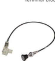
Mechanical remote control