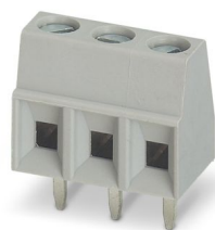
La figura mostra la versione a 3 poli, colore grigio

Morsetto circuito stampato, corrente nominale: 13,5 A, tensione di dimensionamento (III/2): 200 V, sezione nominale: 1,5 mm 2 , numero dei potenziali: 8, numero di file: 1, numero di poli per fila: 8, serie di prodotti: BC-X9, passo: 3,5 mm, tipo di connessione: Connessione a vite con gabbia, forma di attacco delle viti: L Fessura longitudinale, montaggio: Saldatura a onde, direzione di collegamento conduttore/scheda: 0 °, colore: nero, Layout Pin: Pinning lineare, Lunghezza pin [P]: 3,5 mm, numero di pin di saldatura per potenziale: 1, tipo di confezione: confezionato nel cartone