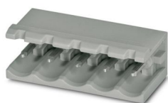
La figura illustra la versione a 5 poli dell'articolo

Pres a base per circuiti stampati, sezione nominale: 2,5 mm 2 , colore: grigio segnale, corrente nominale: 12 A, tensione di dimensionamento (III/2): 320 V, superficie contatti: Sn, tipo di connessione del contatto: Spina, numero dei potenziali: 7, numero di file: 1, numero poli: 7, numero di connessioni: 7, serie di prodotti: BCH-H, passo: 5,08 mm, montaggio: Saldatura a onde, layout pin: Pinning lineare, lunghezza pin [P]: 3,23 mm, numero di pin di saldatura per potenziale: 1, sistema di spine: BASICLINE 2,5, Orientamento pin d'inserimento: Standard, bloccaggio: assente, tipo di fissaggio: assente, tipo di confezione: confezionato nel cartone