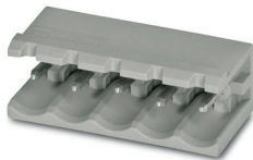
La figura illustra la versione a 5 poli dell'articolo

Preso base per circuiti stampati, sezione nominale: 2,5 mm 2 , colore: grigio segnale, corrente nominale: 12 A, tensione di dimensionamento (III/2): 320 V, superficie contatti: Sn, tipo di connessione del contatto: Spina, numero dei potenziali: 2, numero di file: 1, numero poli: 2, numero di connessioni: 2, serie di prodotti: BCH-H, passo: 5 mm, montaggio: Saldatura a onde, layout pin: Pinning lineare, lunghezza pin [P]: 3,23 mm, numero di pin di saldatura per potenziale: 1, sistema di spine: BASICLINE 2,5, Orientamento pin d'inserimento: Standard, bloccaggio: assente, tipo di fissaggio: assente, tipo di confezione: confezionato nel cartone