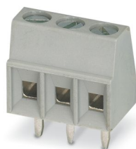
La figura illustra la variante a 3 poli

Morsetto circuito stampato, corrente nominale: 13,5 A, tensione di dimensionamento (III/2): 200 V, sezione nominale: 1,5 mm 2 , numero dei potenziali: 5, numero di file: 1, numero di poli per fila: 5, serie di prodotti: BC-X9, passo: 3,5 mm, tipo di connessione: Connessione a vite con gabbia, forma di attacco delle viti: L Fessura longitudinale, montaggio: Saldatura a onde, direzione di collegamento conduttore/scheda: 0 °, colore: grigio segnale, Layout Pin: Pinning lineare, Lunghezza pin [P]: 3,5 mm, numero di pin di saldatura per potenziale: 1, tipo di confezione: confezionato nel cartone