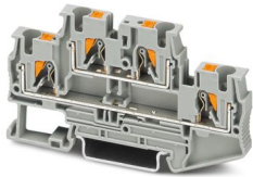
La figura mostra l'articolo in grigio

Si prega di notare che i dati visualizzati in questo PDF sono stati generati dal nostro catalogo online. I dati completi sono disponibili nella documentazione per l'utente. Si applicano le condizioni generali di utilizzo per i download.