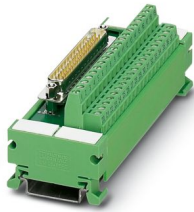
La figura illustra la versione UM 45-D37SUB/S

Si prega di notare che i dati visualizzati in questo PDF sono stati generati dal nostro catalogo online. I dati completi sono disponibili nella documentazione per l'utente. Si applicano le condizioni generali di utilizzo per i download.