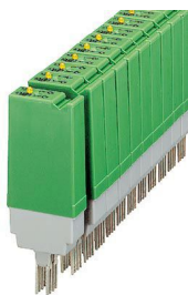
La figura illustra la versione ST-REL 2-KG 24/1 AU

Si prega di notare che i dati visualizzati in questo PDF sono stati generati dal nostro catalogo online. I dati completi sono disponibili nella documentazione per l'utente. Si applicano le condizioni generali di utilizzo per i download.