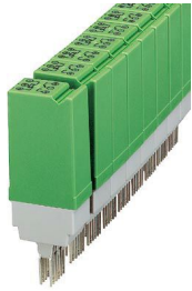
La figura illustra la versione ST-REL3-SG-B 24/21/M

Si prega di notare che i dati visualizzati in questo PDF sono stati generati dal nostro catalogo online. I dati completi sono disponibili nella documentazione per l'utente. Si applicano le condizioni generali di utilizzo per i download.