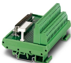
La figura illustra la versione FLKM-D37 SUB/S

Si prega di notare che i dati visualizzati in questo PDF sono stati generati dal nostro catalogo online. I dati completi sono disponibili nella documentazione per l'utente. Si applicano le condizioni generali di utilizzo per i download.