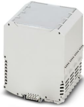
La figura mostra una versione equipaggiata

Si prega di notare che i dati visualizzati in questo PDF sono stati generati dal nostro catalogo online. I dati completi sono disponibili nella documentazione per l'utente. Si applicano le condizioni generali di utilizzo per i download.