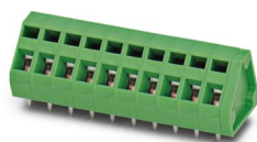
La figura illustra la versione a 10 poli

Morsetto circuito stampato, corrente nominale: 16 A, tensione di dimensionamento (III/2): 400 V, sezione nominale: 1,5 mm 2 , numero dei potenziali: 4, numero di file: 1, numero di poli per fila: 4, serie di prodotti: ZFKDS(A) 1,5, passo: 5,08 mm, tipo di connessione: Connessione a molla, montaggio: Saldatura a onde, direzione di collegamento conduttore/scheda: 45 °, colore: nero, Layout Pin: Pinning lineare, Lunghezza pin [P]: 3,5 mm, numero di pin di saldatura per potenziale: 2, tipo di confezione: confezionato nel cartone