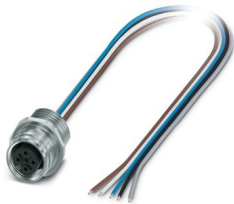
La figura mostra la versione a 5 poli

Si prega di notare che i dati visualizzati in questo PDF sono stati generati dal nostro catalogo online. I dati completi sono disponibili nella documentazione per l'utente. Si applicano le condizioni generali di utilizzo per i download.