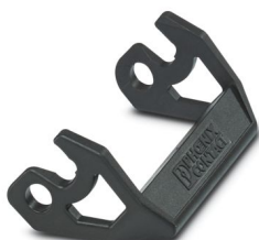
Bloccaggio longitudinale in plastica di ricambio, per custodia HC-EVO-D25.....BK

Si prega di notare che i dati visualizzati in questo PDF sono stati generati dal nostro catalogo online. I dati completi sono disponibili nella documentazione per l'utente. Si applicano le condizioni generali di utilizzo per i download.