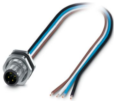
La figura mostra la versione da 4 poli, codifica A

Si prega di notare che i dati visualizzati in questo PDF sono stati generati dal nostro catalogo online. I dati completi sono disponibili nella documentazione per l'utente. Si applicano le condizioni generali di utilizzo per i download.