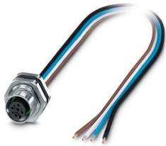
La figura mostra la versione da 4 poli, codifica A

Si prega di notare che i dati visualizzati in questo PDF sono stati generati dal nostro catalogo online. I dati completi sono disponibili nella documentazione per l'utente. Si applicano le condizioni generali di utilizzo per i download.