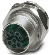
Passaparete M12, montaggio posteriore

Si prega di notare che i dati visualizzati in questo PDF sono stati generati dal nostro catalogo online. I dati completi sono disponibili nella documentazione per l'utente. Si applicano le condizioni generali di utilizzo per i download.