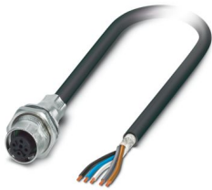
Secondo la figura

Si prega di notare che i dati visualizzati in questo PDF sono stati generati dal nostro catalogo online. I dati completi sono disponibili nella documentazione per l'utente. Si applicano le condizioni generali di utilizzo per i download.