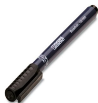
Penna di siglatura

https://www.phoenixcontact.com/it/prodotti/1414105