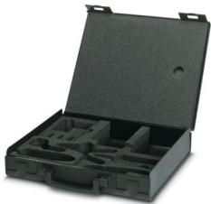
Valigetta di ricambio, vuota

https://www.phoenixcontact.com/it/prodotti/1414095