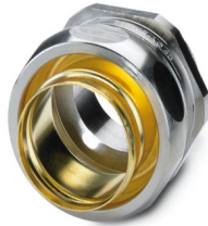
Connessione a vite in ottone con filettatura metrica, grado di protezione IP65

Si prega di notare che i dati visualizzati in questo PDF sono stati generati dal nostro catalogo online. I dati completi sono disponibili nella documentazione per l'utente. Si applicano le condizioni generali di utilizzo per i download.