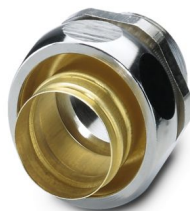
Connessione a vite in ottone con filettatura metrica, grado di protezione IP65

Si prega di notare che i dati visualizzati in questo PDF sono stati generati dal nostro catalogo online. I dati completi sono disponibili nella documentazione per l'utente. Si applicano le condizioni generali di utilizzo per i download.