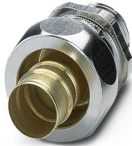
Connessione a vite in ottone con filettatura metrica, grado di protezione IP65

Si prega di notare che i dati visualizzati in questo PDF sono stati generati dal nostro catalogo online. I dati completi sono disponibili nella documentazione per l'utente. Si applicano le condizioni generali di utilizzo per i download.