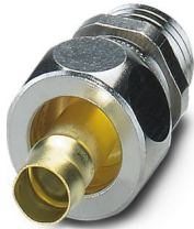
Connessione a vite in ottone con filettatura Pg, grado di protezione IP65

Si prega di notare che i dati visualizzati in questo PDF sono stati generati dal nostro catalogo online. I dati completi sono disponibili nella documentazione per l'utente. Si applicano le condizioni generali di utilizzo per i download.