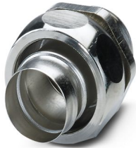
Connessione a vite in ottone con filettatura metrica, grado di protezione IP40

Si prega di notare che i dati visualizzati in questo PDF sono stati generati dal nostro catalogo online. I dati completi sono disponibili nella documentazione per l'utente. Si applicano le condizioni generali di utilizzo per i download.