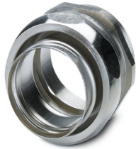
Connessione a vite in ottone con filettatura Pg, grado di protezione IP40

Si prega di notare che i dati visualizzati in questo PDF sono stati generati dal nostro catalogo online. I dati completi sono disponibili nella documentazione per l'utente. Si applicano le condizioni generali di utilizzo per i download.