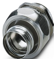
Connessione a vite in ottone con filettatura Pg, grado di protezione IP40

Si prega di notare che i dati visualizzati in questo PDF sono stati generati dal nostro catalogo online. I dati completi sono disponibili nella documentazione per l'utente. Si applicano le condizioni generali di utilizzo per i download.