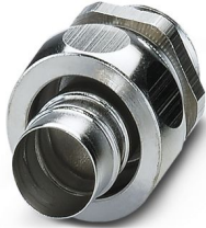
Connessione a vite in ottone con filettatura Pg, grado di protezione IP40

Si prega di notare che i dati visualizzati in questo PDF sono stati generati dal nostro catalogo online. I dati completi sono disponibili nella documentazione per l'utente. Si applicano le condizioni generali di utilizzo per i download.