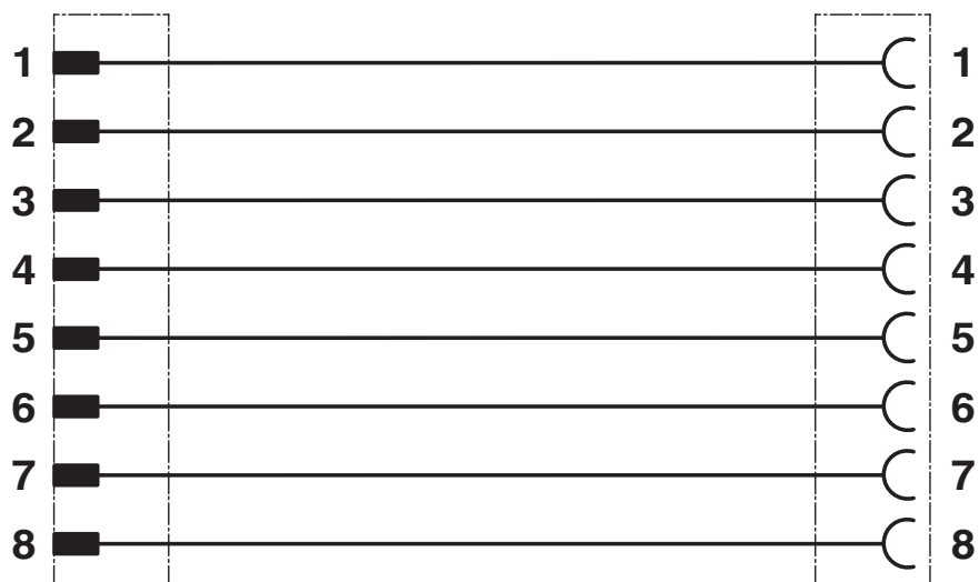
Schema di collegamento

Equipaggiamento dei contatti del connettore maschio M12 e del connettore femmina M12