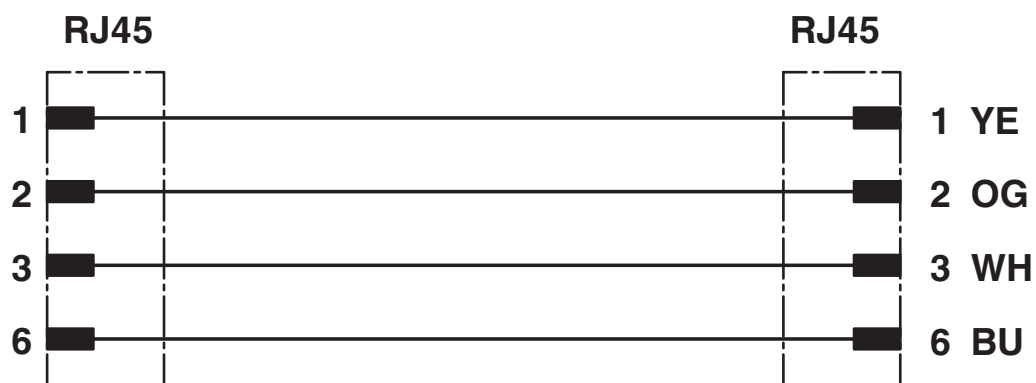
Schema di collegamento