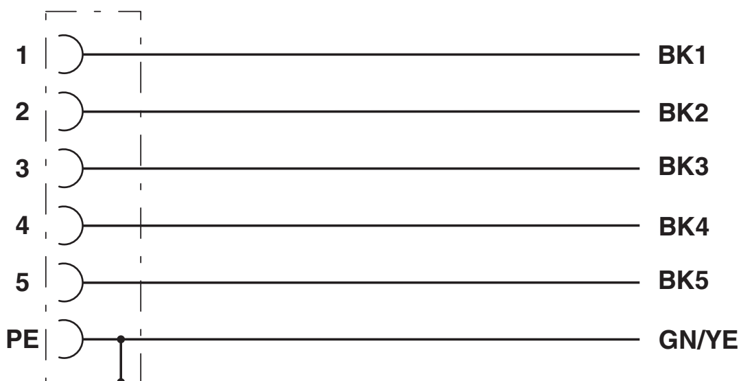
Schema di collegamento

Equipaggiamento dei contatti del connettore femmina M12