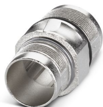
Custodia di accoppiamento per connettori M23 Hybrid

Si prega di notare che i dati visualizzati in questo PDF sono stati generati dal nostro catalogo online. I dati completi sono disponibili nella documentazione per l'utente. Si applicano le condizioni generali di utilizzo per i download.