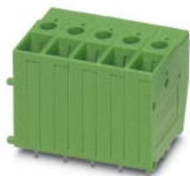
Morsetto per circuiti stampati, numero poli: 1, passo: 7,62 mm, colore: verde

Si ricorda che i dati qui indicati sono estrapolati dal catalogo online. Per informazioni e dati dettagliati, consultare la documentazione per l'utente. Si intendono applicate le Condizioni di utilizzo generali per i download da Internet. ( http://phoenixcontact.it/download )