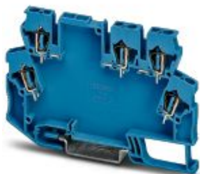
Componente morsetto componibile , colore: blu

Si ricorda che i dati qui indicati sono estrapolati dal catalogo online. Per informazioni e dati dettagliati, consultare la documentazione per l'utente. Si intendono applicate le Condizioni di utilizzo generali per i download da Internet. ( http://phoenixcontact.it/download )