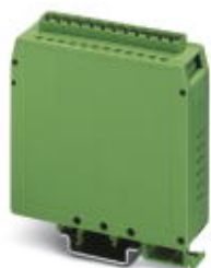
Custodia completa, Custodia completa, colore: verde

Si ricorda che i dati qui indicati sono estrapolati dal catalogo online. Per informazioni e dati dettagliati, consultare la documentazione per l'utente. Si intendono applicate le Condizioni di utilizzo generali per i download da Internet. ( http://phoenixcontact.it/download )