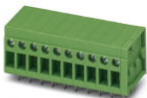
La figura illustra la versione a 10 poli

Si ricorda che i dati qui indicati sono estrapolati dal catalogo online. Per informazioni e dati dettagliati, consultare la documentazione per l'utente. Si intendono applicate le Condizioni di utilizzo generali per i download da Internet. ( http://phoenixcontact.it/download )