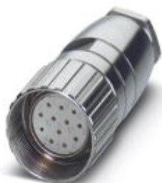
Connettore per cavo, RC, diritto, schermati: no, Bloccaggio a vite, M23

Si ricorda che i dati qui indicati sono estrapolati dal catalogo online. Per informazioni e dati dettagliati, consultare la documentazione per l'utente. Si intendono applicate le Condizioni di utilizzo generali per i download da Internet. ( http://phoenixcontact.it/download )