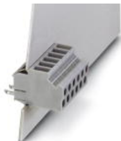
Morsetto passaparete, numero poli: 1, passo: 6 mm, colore: blu, superficie contatti: Stagno

Si ricorda che i dati qui indicati sono estrapolati dal catalogo online. Per informazioni e dati dettagliati, consultare la documentazione per l'utente. Si intendono applicate le Condizioni di utilizzo generali per i download da Internet. ( http://phoenixcontact.it/download )