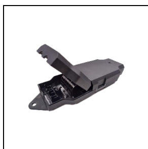
3122585 Modulo Casambi esterno BK-81 / Nero