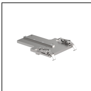
3109552 Supporto per puntatore