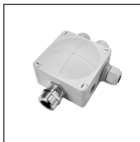
3116044 Kit derivazione Y 2-3 VIE

Al fine di favorire un costante aggiornamento dei propri prodotti, PERFORMANCE iN LIGHTING si riserva il diritto di apportare modifiche senza preavviso. Si invita pertanto a prendere visione dell'ultima versione pubblicata sul sito www.performanceinlighting.com . Flusso luminoso e potenza elettrica sono soggetti ad una tolleranza di +/-7% rispetto al valore indicato. Salvo diversa indicazione, i valori si riferiscono a una temperatura ambiente di 25 ° C. I termini di garanzia sono consultabili all'indirizzo https://www.performanceinlighting.com/gr/company/led-warranty