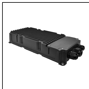
3116295 DRIVER BOX 600 W - 1,4 A - 1 CH - DMX