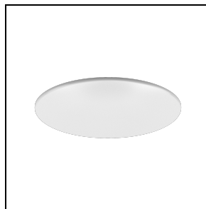
3109009 Diffusore in polimero opaco (IP54) DL ROUND MIDI

Al fine di favorire un costante aggiornamento dei propri prodotti, PERFORMANCE in LIGHTING si riserva il diritto di apportare modifiche senza preavviso. Si invita pertanto a prendere visione dell'ultima versione pubblicata sul sito www.performanceinlighting.com . Flusso luminoso e potenza elettrica sono soggetti ad una tolleranza di +/-7% rispetto al valore indicato. Salvo diversa indicazione, i valori si riferiscono a una temperatura ambiente di 25 ° C. I termini di garanzia sono consultabili all'indirizzo https://www.performanceinlighting.com/gr/company/led-warranty