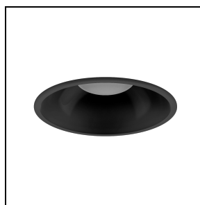
3109007 Riflettore nero DL ROUND MIDI

Al fine di favorire un costante aggiornamento dei propri prodotti, PERFORMANCE IN LIGHTING si riserva il diritto di apportare modifiche senza preavviso. Si invita pertanto a prendere visione dell'ultima versione pubblicata sul sito www.performanceinlighting.com . Flusso luminoso e potenza elettrica sono soggetti ad una tolleranza di +/-7% rispetto al valore indicato. Salvo diversa indicazione, i valori si riferiscono a una temperatura ambiente di 25 ° C. I termini di garanzia sono consultabili all'indirizzo https://www.performanceinlighting.com/gr/company/led-warranty