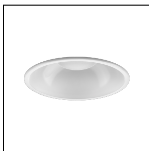
3109006 Riflettore bianco DL ROUND MIDI